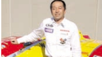
ライジングサン・レーシング ホームページ http://www.tt-sidecar-challenge.jp/