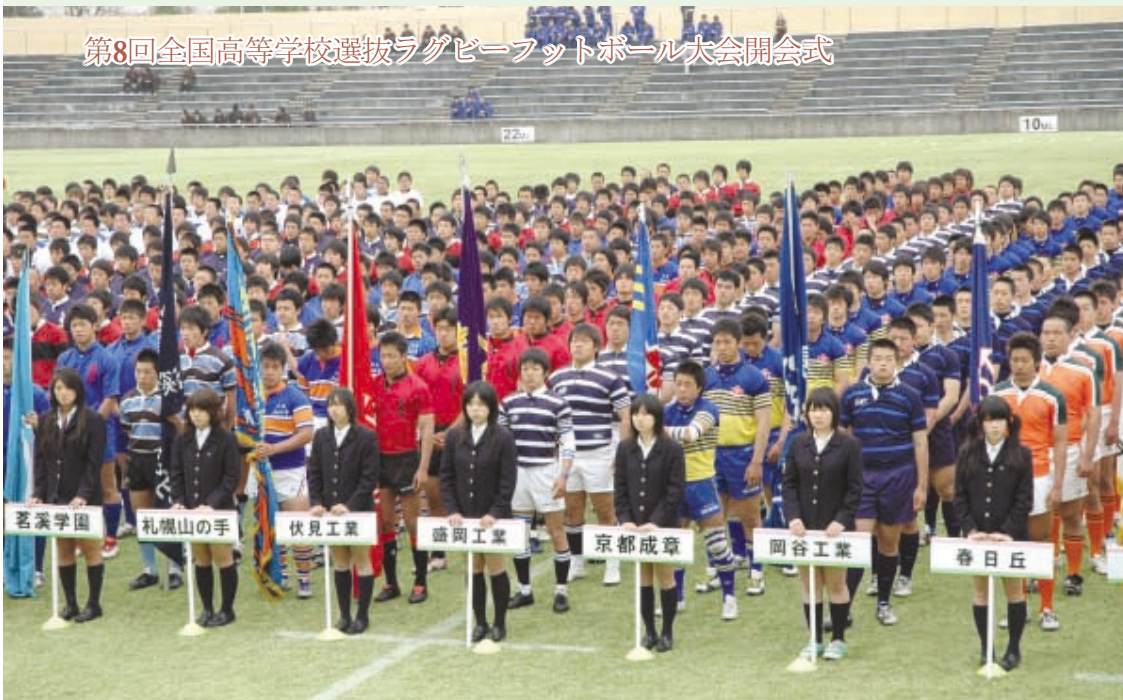
第8回全国高等学校選抜ラグビーフットボール大会開会式